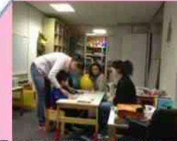
Educ specialisee formation privée