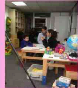
Mère de Keziah en formation privée