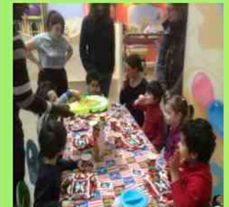
Anniversaire 2013 avec ses camarades de classe, hors de l'école, dans un centre de loisir