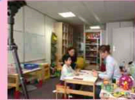
psychologue spécialisée en analyse du trouble du comportement

- Service Neuro Pédiatrique Hôpital Jean Verdier de Bondy 93 Diagnostic TED 100% -Cabinet Psychologues ESPAS IDDEES (92) – -Diagnostic TSA sévère - 2012